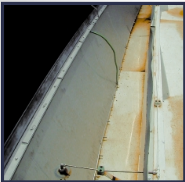
CTS20 secondary tank seal direct na de installatie. Deze seal is uitgevoerd in RVS316 met een geëxtrudeerd lipprofiel in rubbermateriaal dat resistent is tegen hoog aromatische koolwaterstoffen.

CTS kan een tank seal volledig voor u inbouwen, maar onze gedetailleerde tekeningen en installatie handleidingen maken het voor uw aannemer of technische dienst zonder meer mogelijk om CTS seals probleemloos zelf in te bouwen. U kunt in deze gevallen altijd een beroep doen op ervaren CTS personeel om de montage te begeleiden.